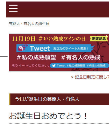
バナー配置イメージ (スマホ)