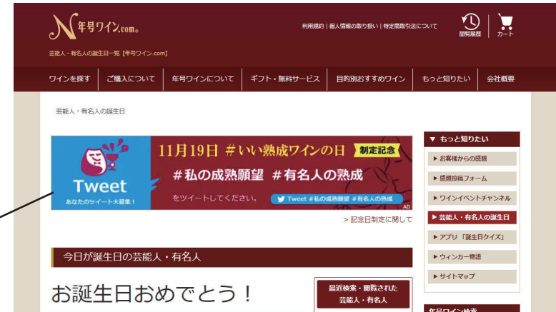
バナー配置イメージ (PC)